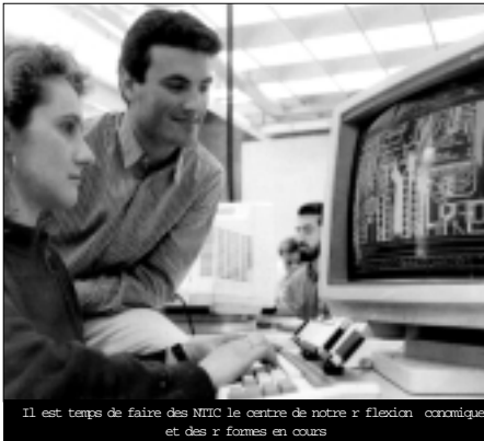
Il est temps de faire des NTIC le centre de notre réflexion économique et des formes en cours

Depuis, d'importantes tapes ont été franchies. Des lois ont été adoptées dans un marché en pleine restructuration. Cette situation nous pousse à nous impliquer de nouveau et agir afin de regrouper les acteurs principaux de ces grandes formes, en vue de les expliquer, de les battre et de proposer des scénarios non cessaires au succès de ces formes, affirme l'organisateur. Connexion 2001 est un salon exposition de cinq jours et un séminaire de quatre jours. Les conférences seront animées par des intervenants algériens d'Algérie, du Canada et de France ainsi que par des experts de la compagnie américaine Cisco. Des visionnaires venus sur grand écran seront organisés avec le Canada et la France. Au cours de ce séminaire, il sera tenu l'assemblée générale constitutive de l'Association algérienne des technologies de l'information. De même se tiendra l'assemblée générale constitutive de l'Association algérienne de la normalisation. Il sera aussi annoncé la création du groupe Linux Algérie pour aider à développer le système dans notre pays. Selon l'organisateur, notre pays dispose de potentialités